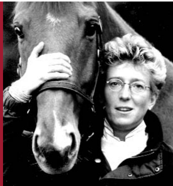
Heike Kemmer , Deutsche Meisterin im Dressurreiten 2005, mehrfache Mannschaftsolympiasiegerin

Sie ist Gründungsmitglied des Lions Club Aegidius und engagiert sich dafür, ein Haus für behinderte und schwerst-kranke Kinder zu bauen, die von ihren Familienangehörigen rund um die Uhr gepflegt werden müssen.