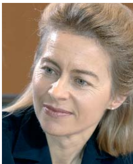
Ursula von der Leyen: Sieben Kinder in Hannover und ein Ministeramt in Berlin: geht doch!

Auch bei uns tritt dieser Trend deutlich zutage: seit dem letzten Herbst wird Deutschland von einer Kanzlerin, Angela Merkel, regiert. Und wir Niedersachsen haben mit Ursula von der Leyen eine weitere Spitzenpolitikerin in Berlin am Start.