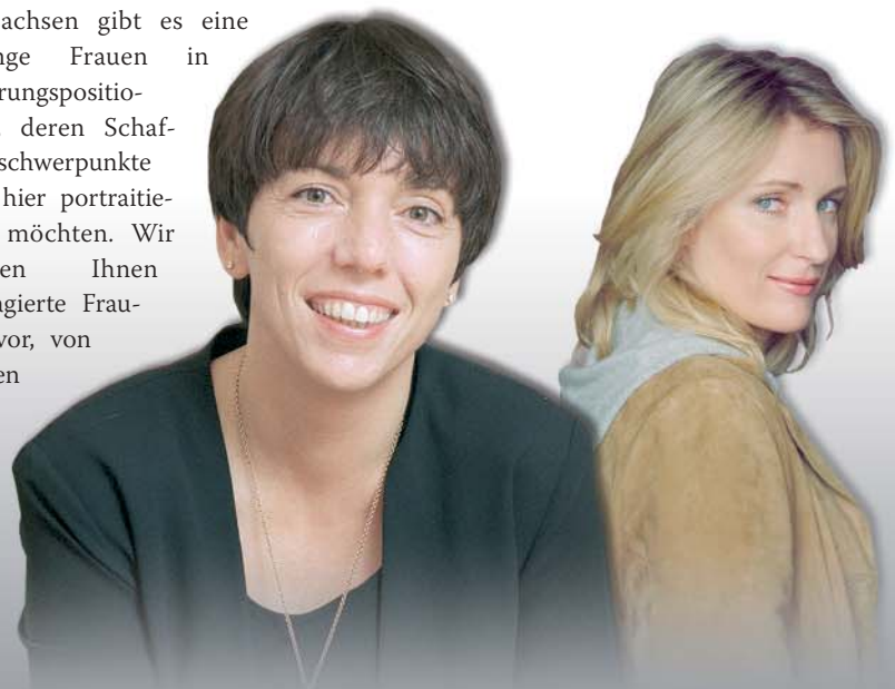
Margot Käßmann: Landesbischöfin und Mutter, die Familie gibt ihr Rückhalt