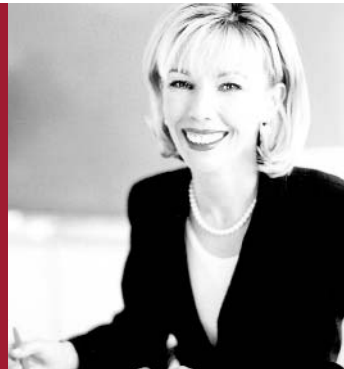
Doris Schröder Köpf Schirmherrin der Stiftung Dt. Kinder-, Jugend- und Elterntelefone

Sie unterstützt die Deutsche Multiple Sklerose Gesellschaft (DMSG) und das NKR sowie das Opernhaus im kulturellen Bereich.